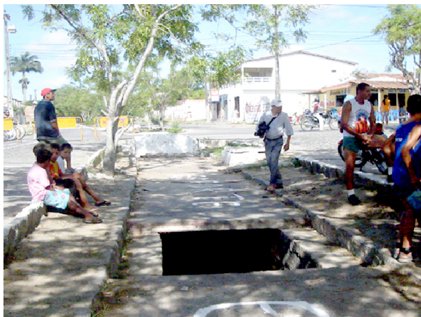
Imagem 06: Trecho do canal deteriorado: o convívio social em meio ao perigo e ao mau cheiro.